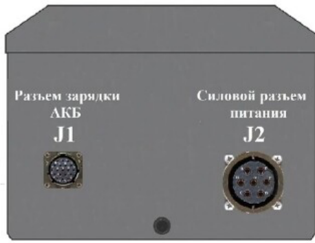
Передняя панель АКБ