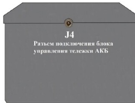
Задняя панель АКБ