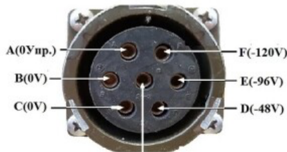
J2 - силовой разъем питания