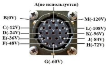
J1 - разъем зарядки АКБ